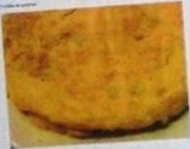
7€ A PORZIONE

Non solo semplice frittata con patate. Quest'ultimo, infatti, permette anche di realizzare un'ottima tortilla con il solo aiuto della padella.