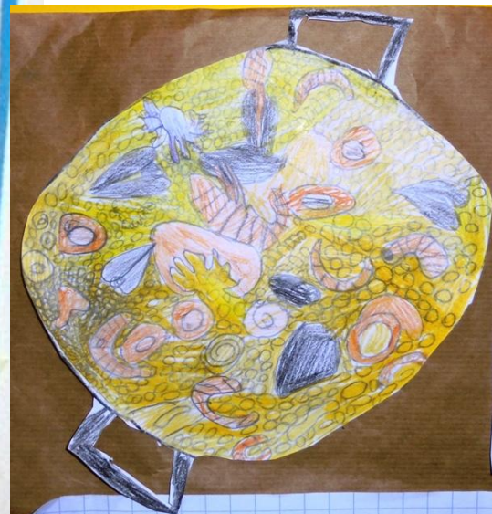
LE TAPAS DI PIÙ GUSTI 12€ A 2 PERSONE

Le tapas sono una specialità, una piccola porzione di cibo, spesso con un aperitivo. Si preparano in modo da essere gustate in compagnia.